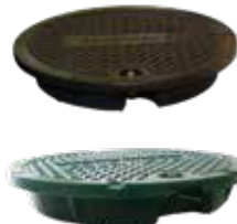
PEHD poklop A15 DN400 černý nebo zelený