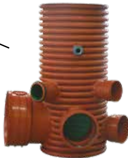
Šachtové prodloužení DN/ID 400