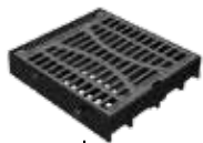
Poklop D400 500x500mm rovný