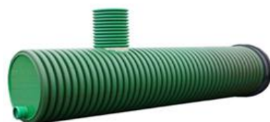
Vhodné pro výrobu šachet, jímk a retenčních nádrží