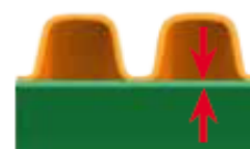
síla vnitřní stěny dle normy EN 13476-3