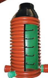
Vhodné pro výrobu šachet a jímk